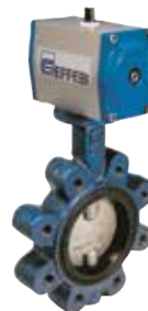
Бътерфлай клапа с двойно действие пневматична задвижка Butterfly valve with double action pneumatic actuator