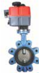
Бътерфлай клапа с електрическа задвижка Butterfly valve with electric actuator